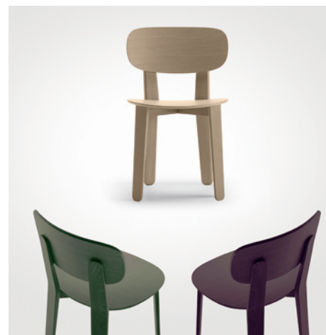
Air chair – VIA Chaise Triku – Alki